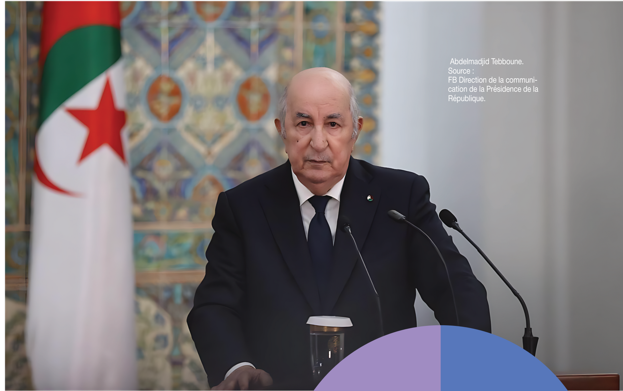
Abdelmadjid Tebboune.

Alger va créer une carte d'importateur-exportateur. Objectif affiché : renforcer la traçabilité des échanges.